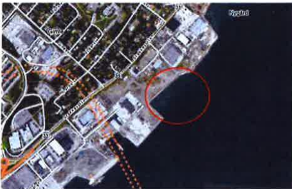
Figur 1: Oversiktsbilde Breivik nord. Sjeté anlegges innenfor rød sirkel.

Sjøbunnen i deponiområdet ligger i dag mellom kote minus 5 og minus 10. Løsmassetykkelsen er 4 - 9 m, og består i hovedsak av bløte korallsilt og leirmasser. Multiconsult har antatt total sprengsteinsmasse på 28 000 m 3 . Nødvendig lengde på mudringsrenne for få benyttet massene blir ca. 150 m. Den nederste meteren i fyllinga skal fungere som et friksjonslag mot underlaget, og kan ikke inneholde finstoff. Det forventes ikke å være hensiktsmessig å sortere sprengstein fra utdypingen, slik at disse massene mest sannsynlig må tilføres fra steinbrudd på land.